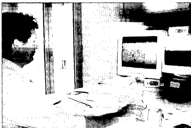
Une carte qui a demandé beaucoup de travail